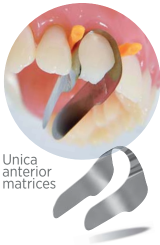
Unica anterior matrices